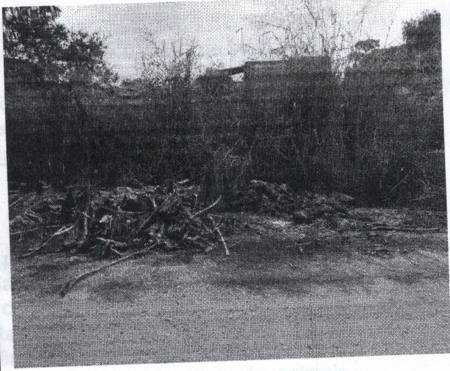
Mato e restos de limpezas de quintais.