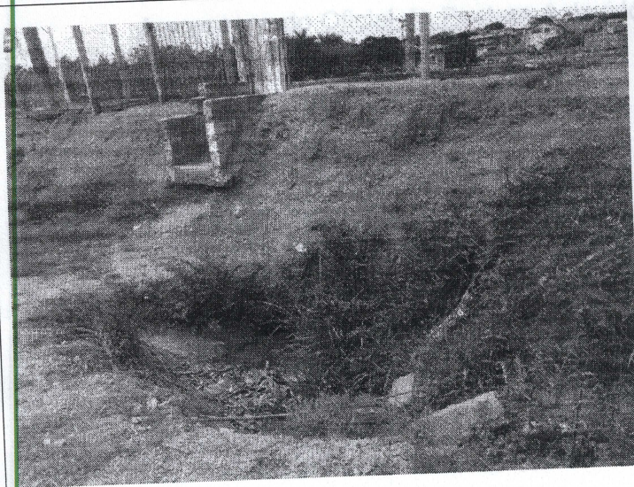
Boca de lobo aberta sem proteção.