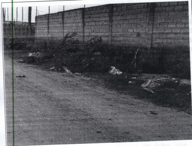
Acumulo de lixo e entulho.